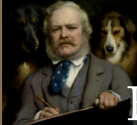
Illustration de couverture : Sir Edwin Landseer (1802-1873), The Connoisseurs/Les Connoisseurs, 1865. Huile sur toile, 92,4 x 72,1 cm. Royal Collection Trust, inv. 403220