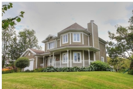
b) Habitat individuel en banlieue