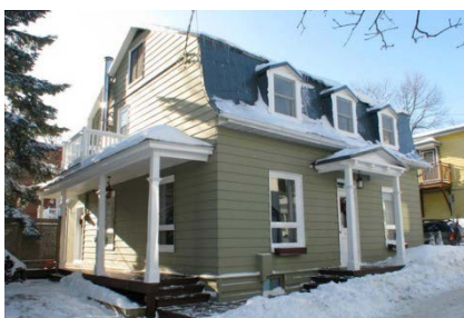
d) Habitat individuel ville