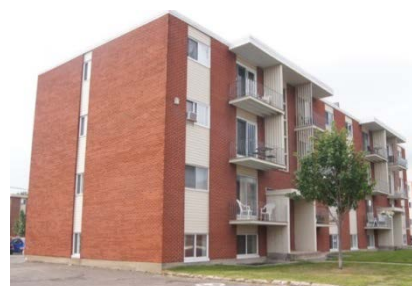
f) Moyen habitat collectif