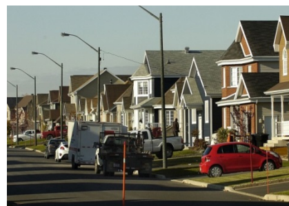
c) Habitat individuel en banlieue 2