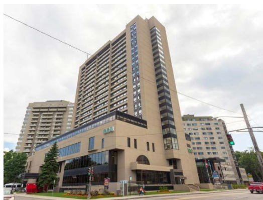
g) Grand immeuble