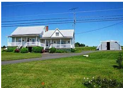
a) Habitat individuel en campagne