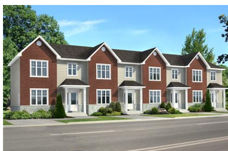
e) Habitat individuel ville2